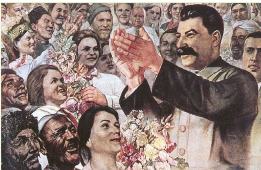
Document 1 : Affiche de 1937 en l'honneur de Staline. Manuel d'histoire-géographie 3°, Nathan, 2003

L'URSS naît de la révolution menée par les Bolcheviks en octobre 1917 . Le programme de leur chef, Lénine , est la poursuite de la révolution jusqu'au triomphe du communisme . Premier Secrétaire du Parti communiste depuis 1922, Joseph Staline élimine ses rivaux. Il impose ses orientations à l'URSS. En 1924, il engage l'Union soviétique dans la « construction du socialisme dans un seul pays ». Staline a comme surnom « le petit père des peuples ».