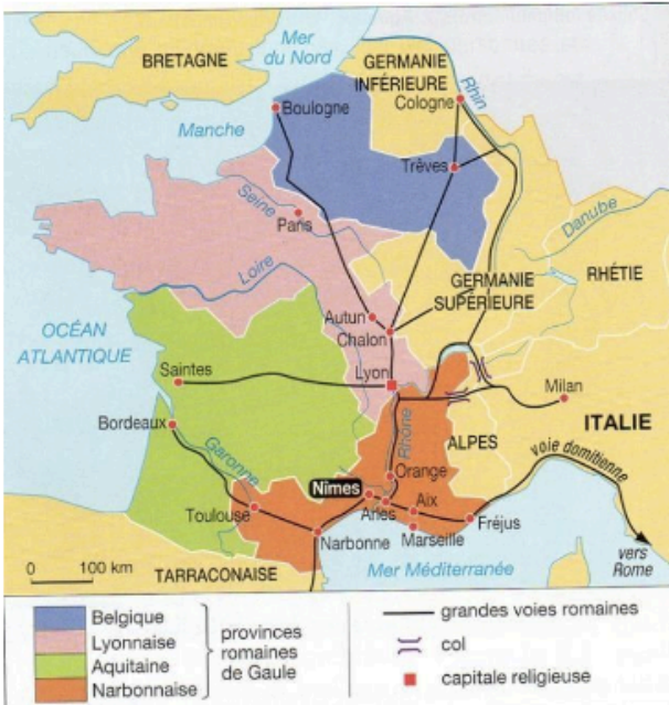
Doc 1 La Gaule romaine